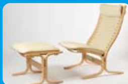
シエスタアイコンハイバック & オットマン