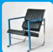
エキスマンタルチェア